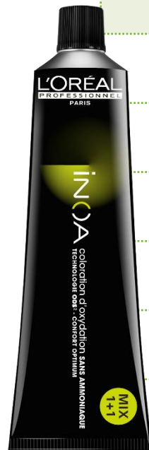
TABLEAU DE NUANCES DE PRÉCOLORATION OU DE REMONTÉE DE COULEUR AVEC INOA