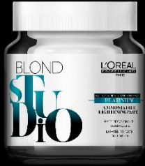
PÂTE PLATINIUM SANS AMMONIAQUE