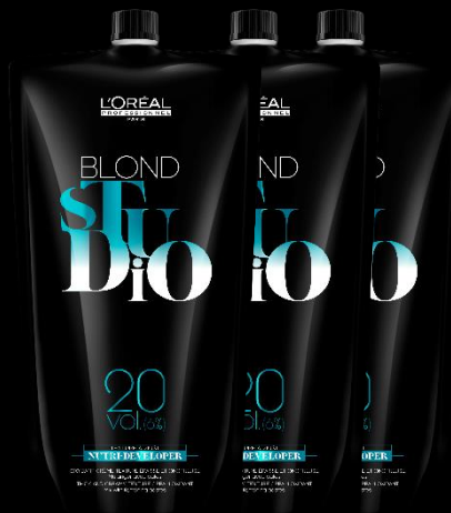
NUTRIDÉVELOPPEURS 20, 30 ET 40 VOL.